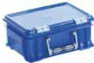
Bei Migros/Coop ca. 39.5 x 29.5 x 17 cm ca. Fr. 25.00